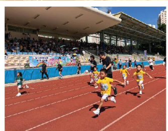
荆葵健兒在運動場上展英姿。