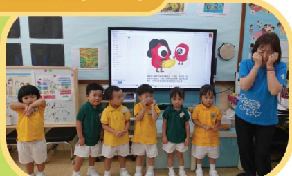
老師利用情緒繪本，讓幼兒分享及表達不同的情緒。