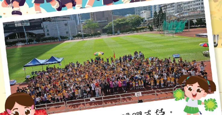
感謝家長們踴躍支持。

2025-2026年度荆葵盛事 - 「親子運動會」於2025年11月8日(星期六)圓滿閉幕，感恩天父賜給我們有晴朗和暖的天氣，讓運動會得以順利舉行。在典禮中，創校校長朱曼喬女士、佛教林金殿紀念小學吳永雄校長、本園校董、家長教師會主席拉着花炮，帶領一眾師生和家長以口號「享受過程，安全第一」，為運動會揭開序幕。眾人隨着音樂跳熱身操「郁郁郁」，讓身體充滿能量，迎接一連串有趣的親子遊戲「空氣棒、魔法飛墊、巨人褲、坦克布」。家長與孩子們透過富合作和互動性的遊戲中增進彼此關係，每張照片也展現了溫馨的笑臉，歡笑聲此起彼落，樂也融融。緊接着的是萬眾期待的接力比賽，而率先開始的是校友接力賽，已畢業的荆葵寶實在跑道上全神貫注地展現努力的一面，奮鬥的體育精神實在是難能可貴。隨即是家校接力賽，家長與老師們共同努力在跑道上創出佳績，看台上的觀眾不斷地為健兒呼歡打氣，熱情充滿了整個會場。壓軸登場的是親子接力賽，家長跑到可愛的荆葵寶實身旁向他們示意，看着孩子向着目標衝線後，不禁地為他們大聲歡呼，給予讚賞和擁抱。一個讚賞、一個擁抱是給予孩子們的鼓勵和肯定，感謝每位家長的參與，讓運動會滿載笑聲與回憶，願孩子們能堅守體育精神，努力奮鬥，在不同的賽道上繼續發光發亮。