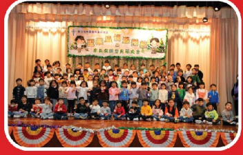
高班(K.3)寶寶為聖誕節獻唱。