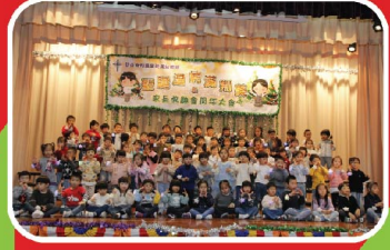
低班(K.2)寶寶透過歌曲讚美上主。