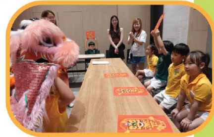
能夠體驗醒獅這中國傳統 藝術，很滿足呢！