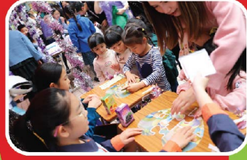
幼兒投入地參與攤位遊戲。