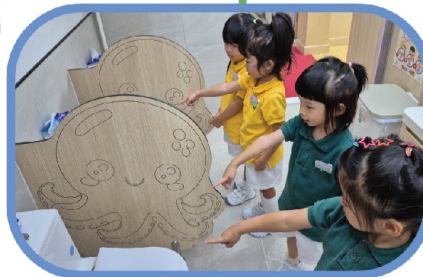
小導遊在介紹學校的設施。