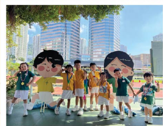
「Yeah! 荆仔和小葵也一起參與運動會。」