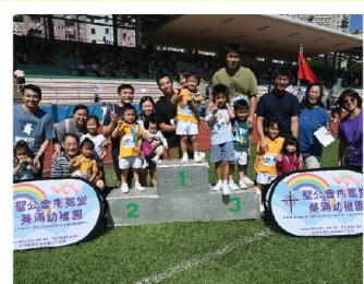
家長與孩子們站在頒獎台，分享努力的成果。