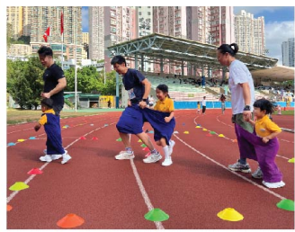
家長與幼兒穿著巨人褲，合拍地繞過障礙物。