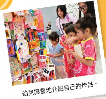
幼兒興奮地介紹自己的作品。

「小手作大創作」中華文化藝術展得以圓滿舉行，在此特別鳴謝各位嘉賓、校董、家長的鼎力支持，相信透過是次藝術旅程，讓孩子發揮無限的可能，充分展現幼兒的想像力和創造力。