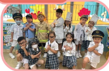
‘Can you guess our jobs?’