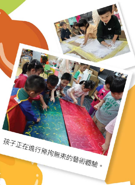
孩子正在進行無拘無束的藝術體驗。