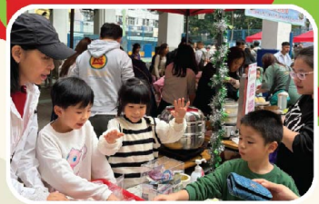
大家紛紛支持曲奇義賣。