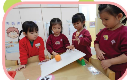
原來要有斜度才可以令球向下滾!