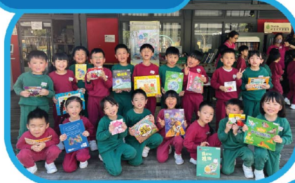
「綠在葵青」的漂書活動真 的很有意義。