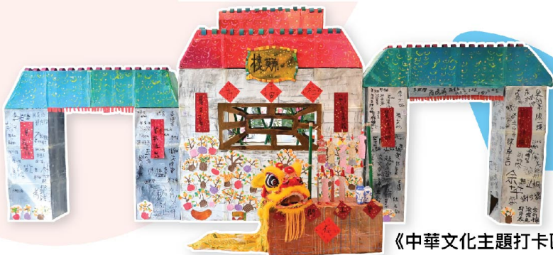
《中華文化主題打卡區》