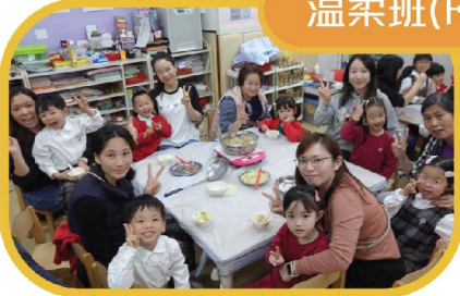
親子自製的手工鯉魚湯麵真美味！