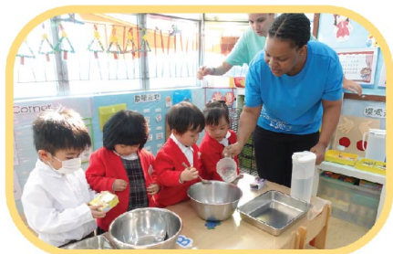
Miss Chido and Miss Chay teach us how to make jelly, yummy! yummy!