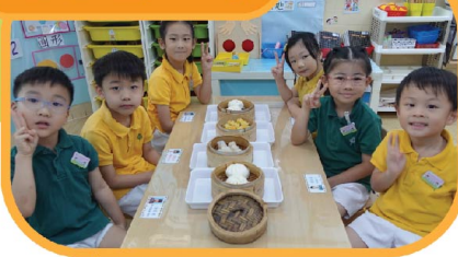
香港特式點心真美味， 我們都愛吃！