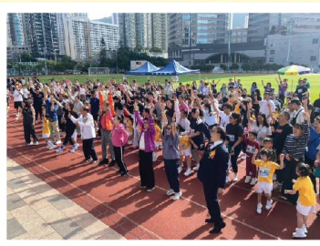
大家一起跳律動《郁郁郁》作為熱身操。