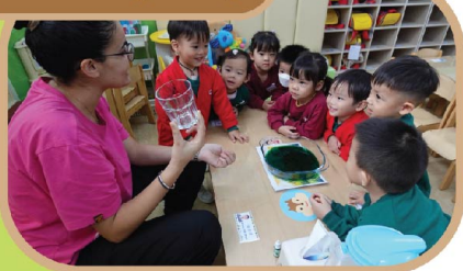
English lesson is fun!