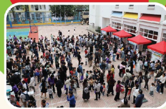
場面非常熱鬧，感謝各位的熱烈支持。