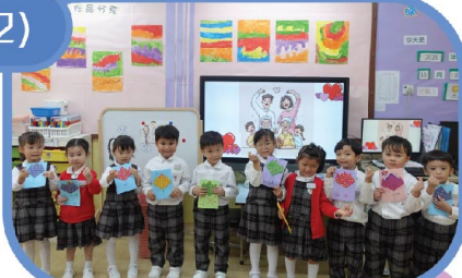
幼兒製作了精美的心意咭送給家人。