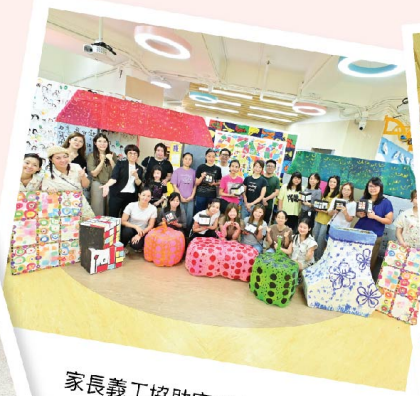
家長義工協助完成大型裝置。