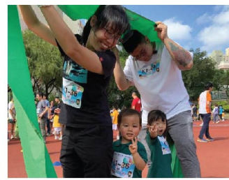
坦克布仿如火車在行駛，真有趣！