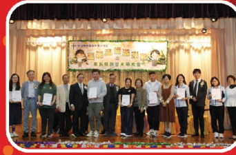
致送聖公會荆葵堂葵涌幼稚園第一屆家長教師會感謝狀。