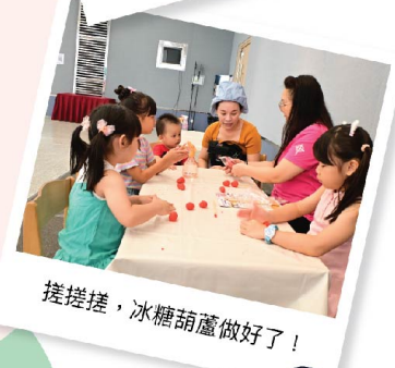
搓搓搓，冰糖葫蘆做好了！