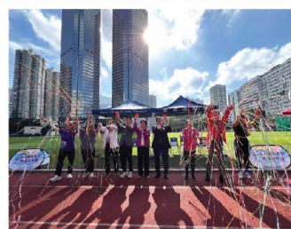
嘉賓們以拉花炮形式為親子運動會揭開序幕。