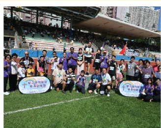
家校接力賽能讓家長與老師們打成一片，共同努力在跑道上創出佳績。