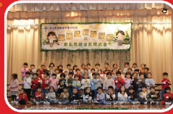
幼班(K.1)寶寶首次在台上表演，真可愛。