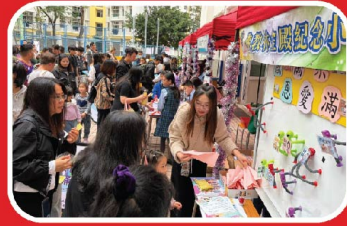
幼兒熱情參與，攤位前人潮滿滿。