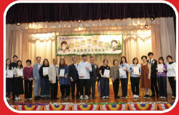
頒發聖公會荆葵堂葵涌幼稚園第二屆家長教師會委任狀。