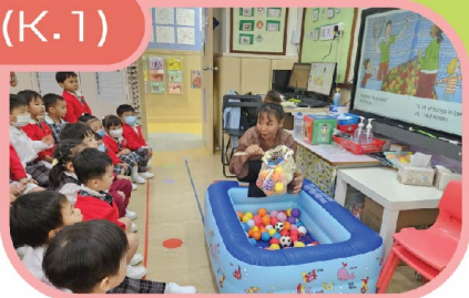
幼兒投入欣賞故事爸媽的分享。