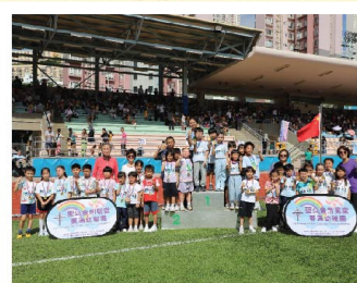
畢業了的荆葵寶寶特意到來參加校友接力賽。