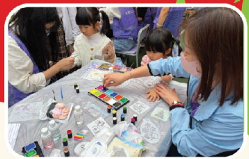
幼兒選擇心儀的圖案請老師進行手部彩繪。