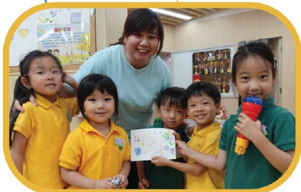
送上心意卡給敬愛的老師。