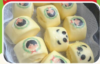
餛飩印有荆仔小葵的模樣，與別不同。