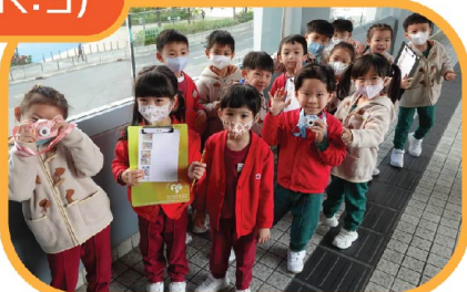
忍耐實實於延展活動中，到葵涌 商場進行觀察。