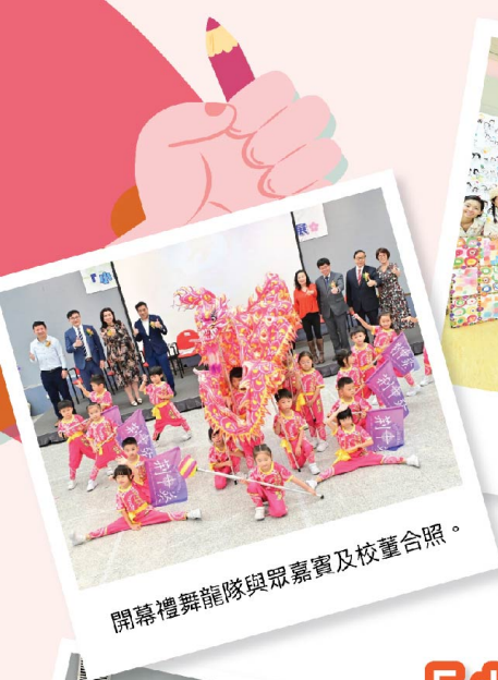
開幕禮舞龍隊與眾嘉賓及校董合照。