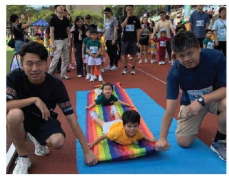
「1,2,3...」，魔法飛墊準備要起程了。