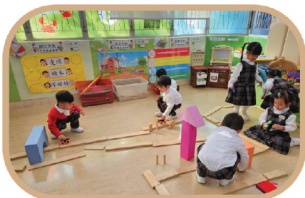
我們齊來探索，運用不同的物料製作路軌。