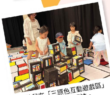
幼兒在「三原色互動遊戲區」探索不同的玩法。