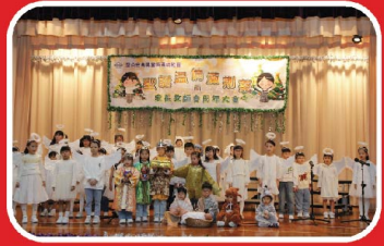
荆葵小綿羊及校友隊演出聖景劇。