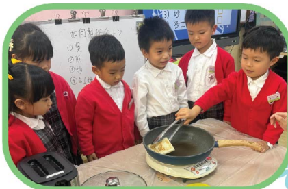
我們一起探索製作多士的方法!