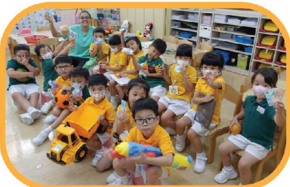
“We buy toys from the toy shop.”