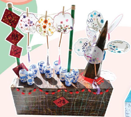
《各式各樣的中華文化作品》