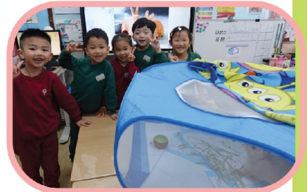
我們要好好愛護小動物， 做個盡責的小主人。