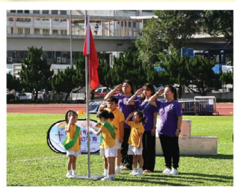
本校升旗隊進行升旗禮。